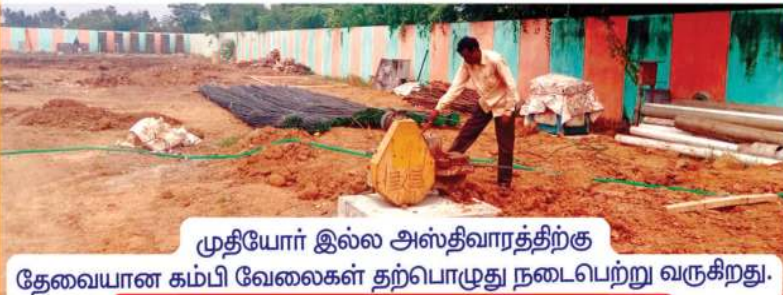
முதியோர் இல்ல அஸ்திவாரத்திற்கு தேவையான கம்பி வேலைகள் தற்பொழுது நடைபெற்று வருகிறது.

முழுவதும் குறிப்பிட்ட காலத்திற்குள் கிடைத்துவிடும் என்பது எங்களது திடமான நம்பிக்கை. முற்றிலும் இலவசமாக செயல்பட உள்ள நமது முதியோர் இல்ல கட்டிடப் பணிகளுக்கு ரூ.5,00,000/- வழங்கும் நன்கொடையாளர்கள் விரும்பும் பெயரில் இம்முதியோர் இல்லத்தில் முதியோர் தங்கும் அறை ஒன்று அமைக்கப்படும். தாங்கள் விரும்பிய தொகை வழங்குவோரின் பெயர்களும் தகுந்த முறையில் பதிவு செய்யப்படும். இந்தக் கனவத் தீட்டம் சீற்ப்பான முறையில் நிறைவேற உங்கள் அனைவரின் நல்லாசீயையும்; தாராளமான நித் உதவியையும் மனதார வேண்டுகிறோம். 🙏