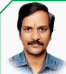
A.American P. R. O.