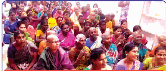
நம்ம தர்மசாலாவில் ஏழை புற்றுநோயாளிகள்

ஆனால், தற்பொழுது கொரோனா என்னும் கொள்ளை நோயின் தாக்கத்தால் உரடடங்கு நிலை இருப்பதால், நம்ம தர்மசாலாவில் தங்கியிருந்த ஏழை புற்றுநோயாளிகள் மற்றும் அவர்களது உதவியாளர்கள் (150 பேர்) அனைவரையும் அவரவர் ஊர்களுக்கு ஒரு மாதத்துக்குரிய மருந்து செலவுக்கானத் தொகையை அளித்து, உரடடங்கு முடிந்த பின்னர் வழக்கம் போல் உங்களது சிகிச்சை காலங்களில் இங்கு வரலாம், உங்கள் நலன் காக்க, உங்கள் தாய்வீடான நம்ம தர்மசாலாவின் கதவுகள் என்றென்றும் திறந்தே இருக்கும் என்கிற நம்பிக்கை வார்த்தைகள் கூறி, அவர்களை தனி வாகனங்கள் மூலம் பத்திரமாக அனுப்பி வைத்துள்ளோம்.