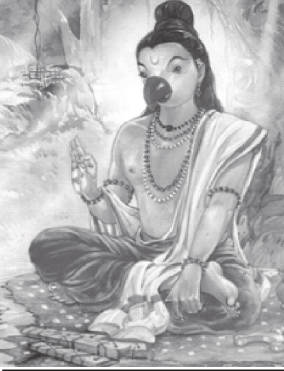
சுக பிரம்ம ரிஷி

முற்காலத்தில் கஷ்டங்களையும், துன்பங்களையும், வேதனைகளையும் அடைந்த மனிதர்கள் தங்கள் மனதை எப்படி மாற்றிக்கொண்டார்கள் என்பதை கதையாக நமக்கு கூறி அதில் அவர்கள் தெரிந்துக்கொண்ட தத்துவங்களை நமக்கு கூறி நாமும் அதே போல் நம் வாழ்வில் உயர்வதற்கான வழிகளைக் காட்டுவதுதான் ஸ்ரீமத் பாகவதம். அப்படிப்பட்ட ஒருவரின் கதைதான் வாசகர்கள் கடந்த இரண்டு மாதங்களாக படித்த “கோகர்ணவின்” கதை.