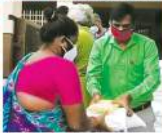
மக்கள் பணியில் ஸ்ரீ மாதா டிரஸ்ட் நிர்வாகி திரு அமெரிக்கன் அவர்கள்

நன்கொடைகளையும், நல்லாசிகளையும் என்றென்றும் மனதார வேண்டுகிறோம். கொரோனாவை முறியடிக்க எதிர்கொள்ளும் போரில் சிக்கித் தவிக்கும் எளிய மக்களை தங்களின் உறவுகளாக எண்ணி உதவி செய்யுங்கள், உங்கள் நன் கொடையில் ஒரு ரூபாய் கூட வீணாகா மல் அது எளிய மக்களைச் சென்றடை யும் என உறுதியளிக்கிறோம். இதன் மூலம் காலத்தால் அழியாத செல்வ மான பெரும் புண்ணியம் உங்களை யும், உங்கள் சந்ததியினரையும் வந்து சேரும் என்பது எங்களது உறுதியான நம்பிக்கை. சிந்தியுங்கள் !