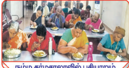
நம்ம தர்மசாலாவில் பசியாறும் ஏழை புற்றுநோயாளிகள்

ஏழை புற்றுநோயாளிகளை காக்கும் சேவையைத் தொடர்வதுடன், மற்றுமொரு முயற்சியாக ஸ்ரீ மாதா டிரஸ்ட் முற்றிலும் இலவசமாக செயல்படுத்த உள்ள ஸ்ரீ ஜயேந்தர்