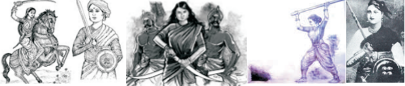
ராணி லக்ஷ்மிபாய், வேலு நாச்சியார், ஒனாகே ஓபாவா

“பாரத தேசம் வீரப் பெண்களின் விளைநிலம்” என்றே குறிப்பிடும் அளவிற்கு தங்களுக்கு நேர்ந்த எத்தனையோ இன்னல்களுக்கு கிடையேயும், வன்கொடுமைகளுக்கிடையேயும் துணிந்து செயல்பட்ட வீர மங்கையர்களின் பட்டியல் மிக அதிகம். இத்தகைய வீரப் பெண்களில் சிலர் இந்த தேசத்திற்காகவும், சிலர் தங்களது தனிப்பட்ட வாழ்க்கைக்காகவும் போராடி வெற்றி கண்டவர்கள். நாம் இரு வகையினரையும் பற்றித் தெரிந்து கெள்வோம்.