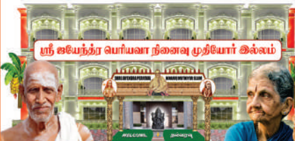
ஸ்ரீ ஜயேந்தர் பெரியவா நினைவு முதியோர் இல்லம்