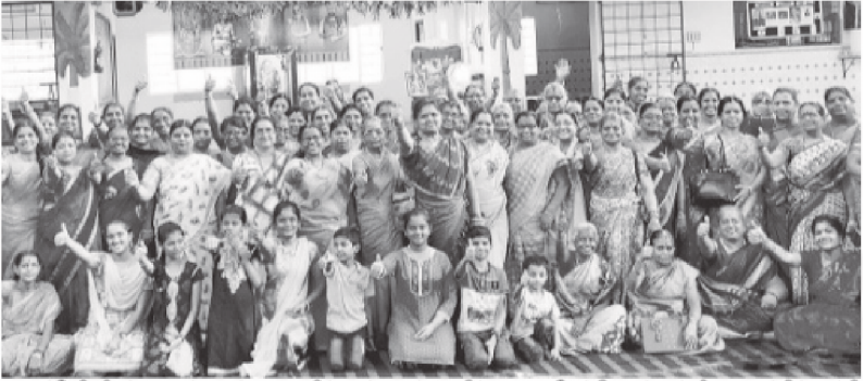
*புதுச்சேரி கிழக்கு கடற்கரைச் சாலையில் உள்ள சங்கர வித்யாலயா மேல்நிலைப் பள்ளி வளாகத்தில், சக்தி வேதபாரதி பண்பாட்டு அமைப்பு சார்பில், உலக மகளிர் தின விழா கொண்டாடப்பட்டது.