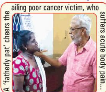
A 'fatherly pat' cheers the